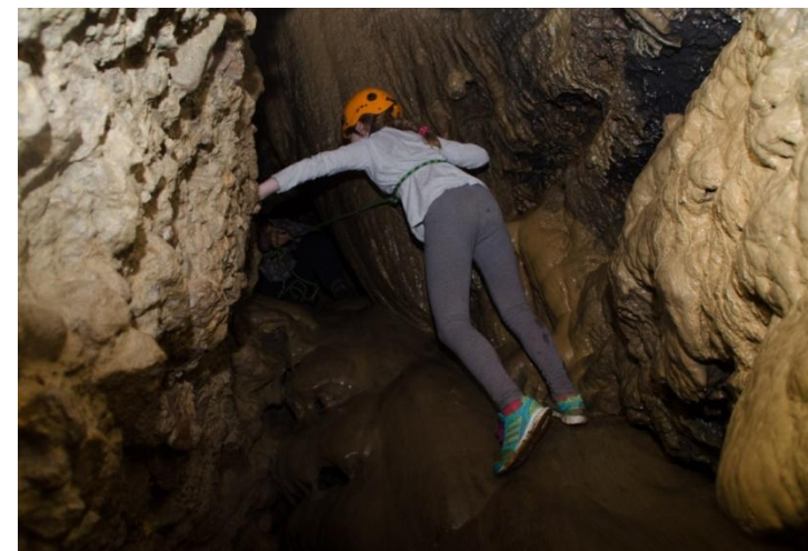
«Большая Фанагорийская пещера»