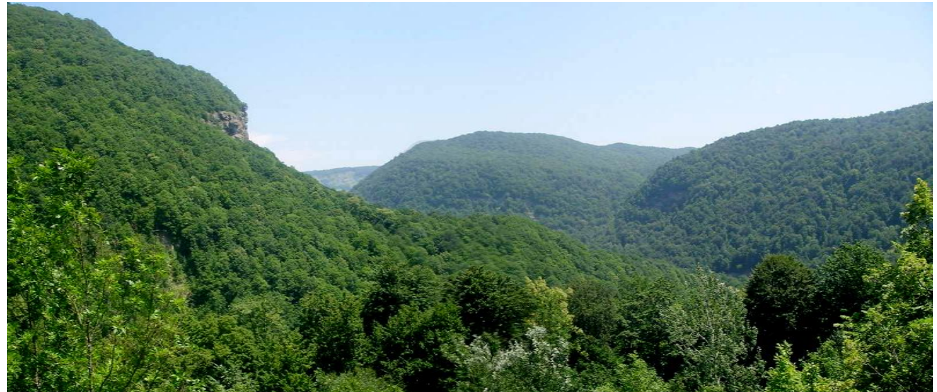
гора Нависла, Медвежьи скалы