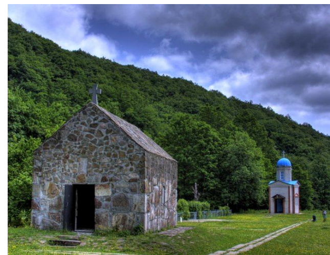
урочище Поднависла, мемориальный комплекс