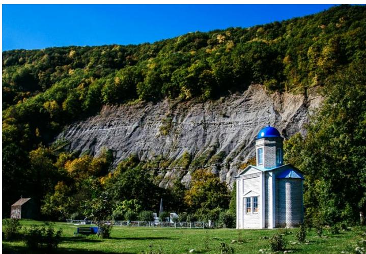
Фото основных природных достопримечательностей: