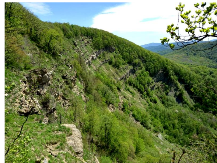
Скалы горы «Чатал-Кая»